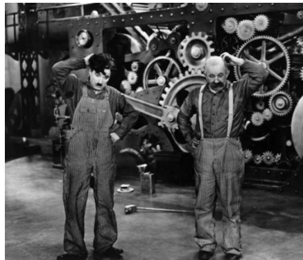
Cena do filme Tempos Modernos

“Tempos modernos, filme de 1936, cuja temática ultrapassa a tragédia da existência individual e coloca em cena o conflito entre o homem e o taylorismo.”